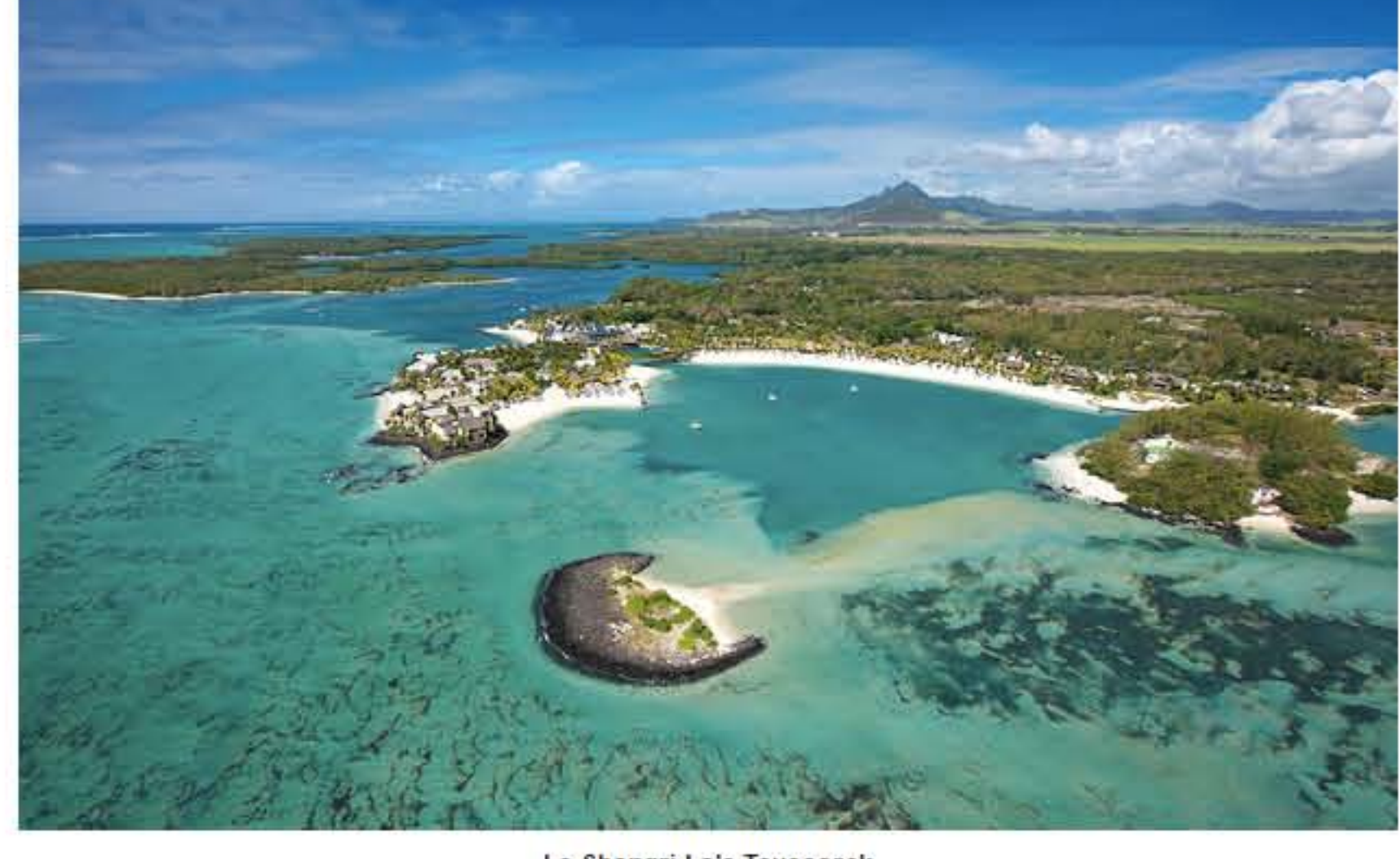
Le Shangri-La's Touessrok

La réputation de l'hôtellerie et de l'accueil mauricien n'est plus à faire... L'hôtellerie haut de gamme dans l'île soeur n'est pas un mythe et certains établissements méritent vraiment le détour. Oubliez quelques références, nous avons été déçus... Coup de coeur pour 3 hôtels, tous très différents, qui portent haut leurs 5 étoiles et qui demeurent, toute proportions gardées, relativement abordables.