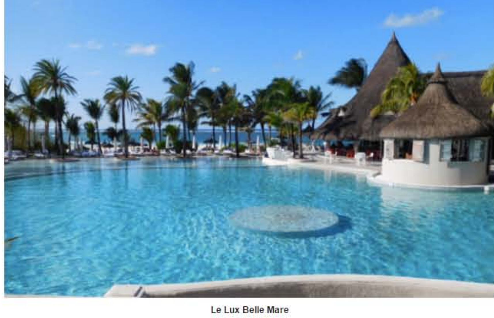
Le Lux Belle Mare

Comptez pour une chambre double Deluxe Garden View par nuit en demi-pension: en haute saison du 1/11/16 au 19/12/16 et du 5/01 au 30/04/17 410€, en peak Season du 16/12/16 au 04/01/17 (séjour de 7 nuits minimum) 580€ et en basse saison du 01 au 31/05/17, 290€ par nuit en demi-pension.